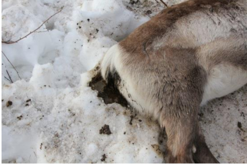
Diarré vid våmacidos