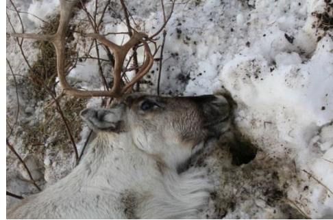
Kräkning vid våmacidos