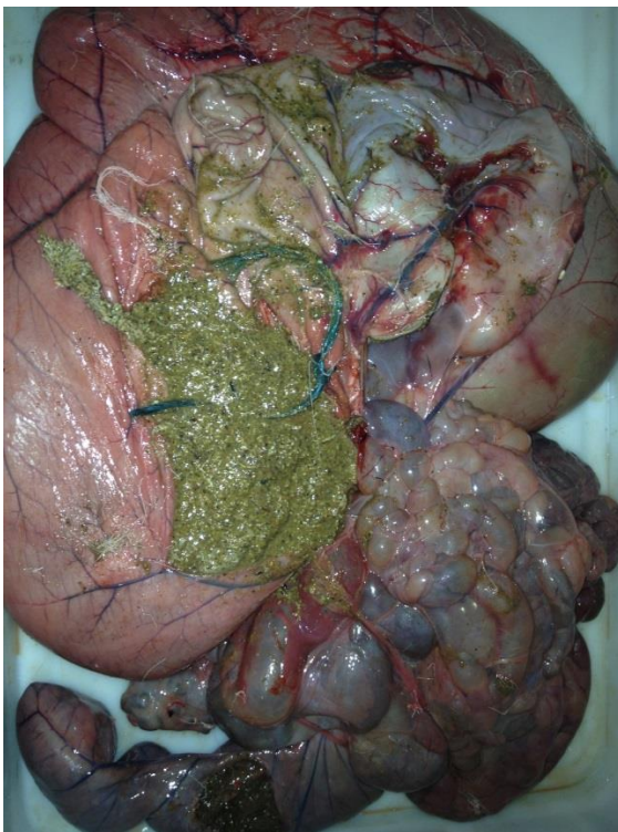
Snöre i våm och nätmage