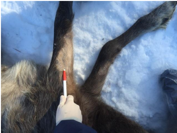
Ren i dålig kondition med rikligt av pälsätande lus