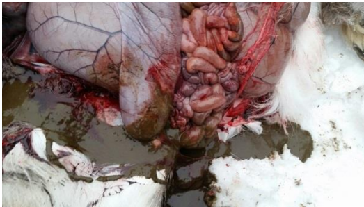
Vattnigt innehåll i våmmen vid våmacidos.