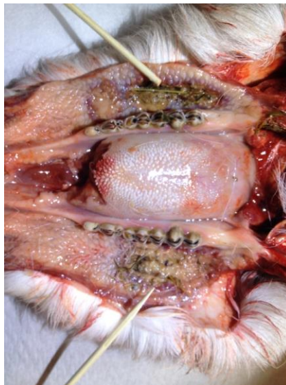
Nekrobacillos i munhålan