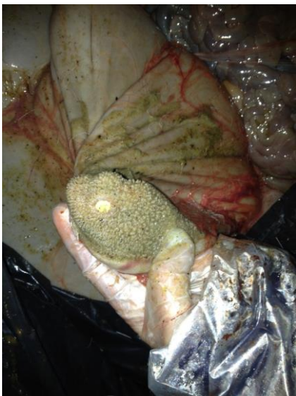
Nekrobacillos i våmmen