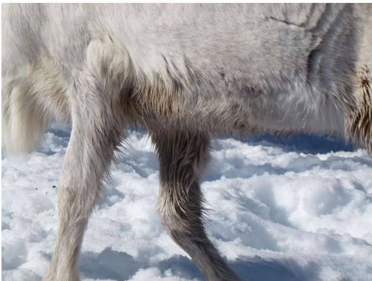
Blöta armbågar och ljumskar hos ren i hägn