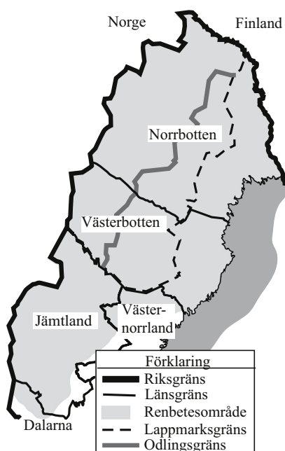
FIGUR 1. Renbetesområdet i norra Sverige

Skogsmarken i norra Sverige erbjuder exempel på sådana problem med gemensamma resurser. Det kan vara exempelvis bär- och svamplockare, jägare, och olika industriella användare, såsom gruvnäring, skogsnäring och rennäring. Konflikter om användning av marken är ett problem för både skogsbruket och rennäringen, eftersom de använder samma marker men i helt skilda syften. Skogsbolagen är främst intresserade av timret medan rennäringen främst är intresserad av betet. I samband med att marken används uppstår negativa effekter för båda parterna. Avverkningar påverkar rennäringens betesmöjligheter negativt medan bete av lav under vintern kan orsaka tramp- och grävskador. De negativa effekterna är dock större för rennäringen än för skogsbruket. Det moderna skogsbruket skapar mer negativa effekter för rennäringen än vad rennäringen skapar för skogsbruket. Skogsbruket å sin sida menar att kostnaderna för att anpassa sig till rennäringens behov är så stora att de inte är ekonomiskt försvarbara.