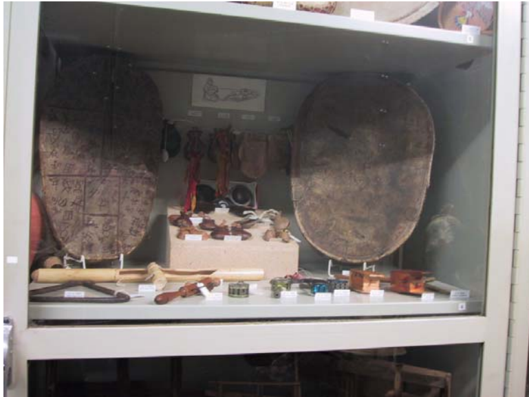
Dom två trummorna vid Museum Europäischer Kulturen, Berlin.

En trumma (Inv. nr II.C.954, Manker nr 5), är en sk. ramtrumma och den enda uppgift som finns om dess ursprung är att den är från Norge eller Sverige. Den kan enligt Mankers klassificering vara från Ranen i Nordlands fylke i Norge eller nordliga Lycksele lappmark i Sverige. Den andra trumman (Inv. nr II.C 955, Manker nr 76) är enl. Manker ett falsarium men med en originaltrumma som förebild, troligen från Torne lappmark (Manker 1938).