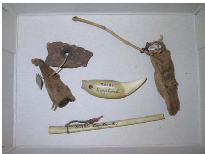
Föremål med religiös anknytning vid Museum für Völkerkunde Dresden.