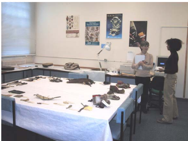
Studierummet vid British Museum, London. Samtliga samiska föremål, förutom textilier, är upplagda på borden.

Vid besöket visades samtliga samiska kulturhistoriska föremål (ej textilier) och Åjtte fick en kopia av museets katalog för de samiska kulturhistoriska föremålen.