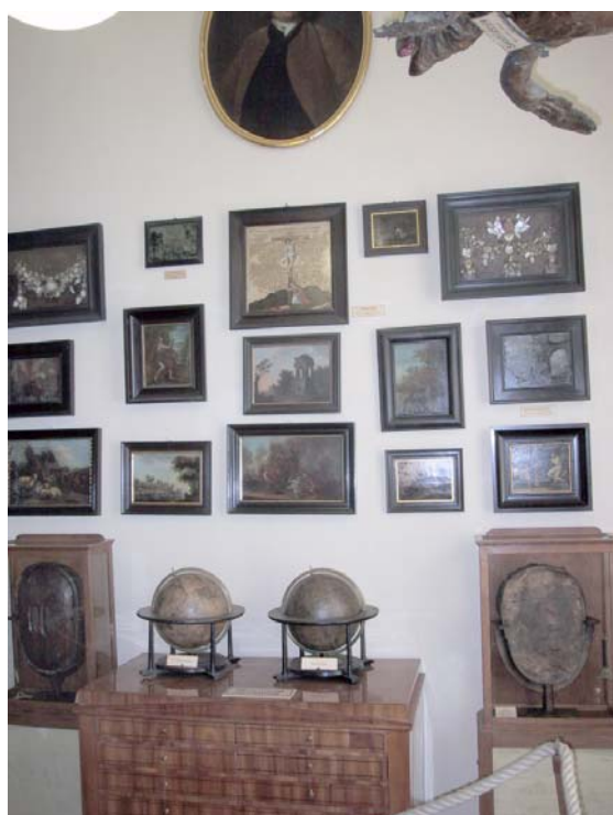
Dom två samiska trummorna vid Naturalienkabinett Waldenburg.

Naturalienkabinett Waldenburg renoverades 1989 och presenteras nu som ”ett museum i ett museum”, dvs. samlingen visas upp på det sätt det gjordes när samlingarna först visades 1932. Trummorna visas upp tillsammans med andra ”exotiska” och märkliga ting till exempel en kalv med två huvuden. Montrarna är enkla och skåltrumman (inv. nr 129, Mankers nr 49) står vid fönstret som täckts endast av en tunn gardin.