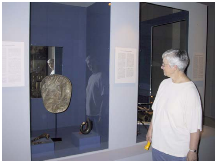
Den samiska trumman i utställningen ”Gaben an die residenz” vid Museum für Völkerkunde Dresden.

Den äldsta anteckningen som finns om trumman är från 1668 .Enligt Manker är trumman är av Luletyp (Manker 1938).