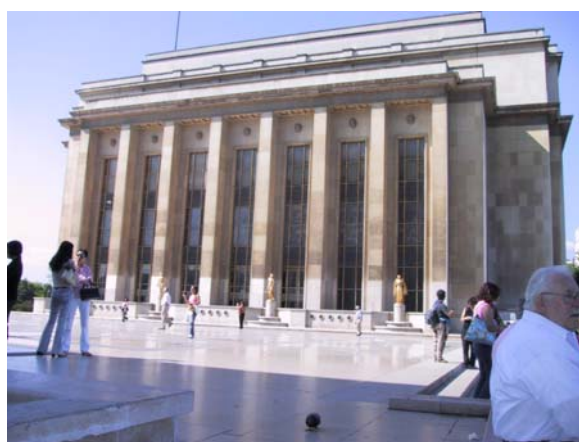
Musée de l'Homme ovan och delar av den samiska samlingen i magasinerna till höger.

Ingen vid Musée de l'Homme har svarat på enkäten trots ett flertal påminnelser, det kan troligen förklaras med att museet är under en omstrukturering och det är stor tidsbrist för alla men även språket kan utgöra ett hinder då enkäten är på engelska. Det som framkommit om samlingen är endast det att den är mycket intressant samt att föremålen kom till museet på slutet av 1800-talet (De Sike, pers.inf. 2004-05-25).