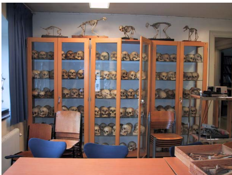
Kraniesamlingen vid Stockholms universitets osteologiska forsknings Laboratorium