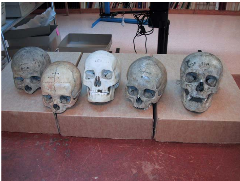
Samiska kranier vid Lunds universitet historiska museum. Foto, Gunilla Edbom, Åjtte.

Universitetsledningen kommer att fatta ett principbeslut angående utlämnande av skelett, men vet det kommer att innebära är i skrivande stund ännu oklart (Olsson, pers. inf. 2005-01-17).