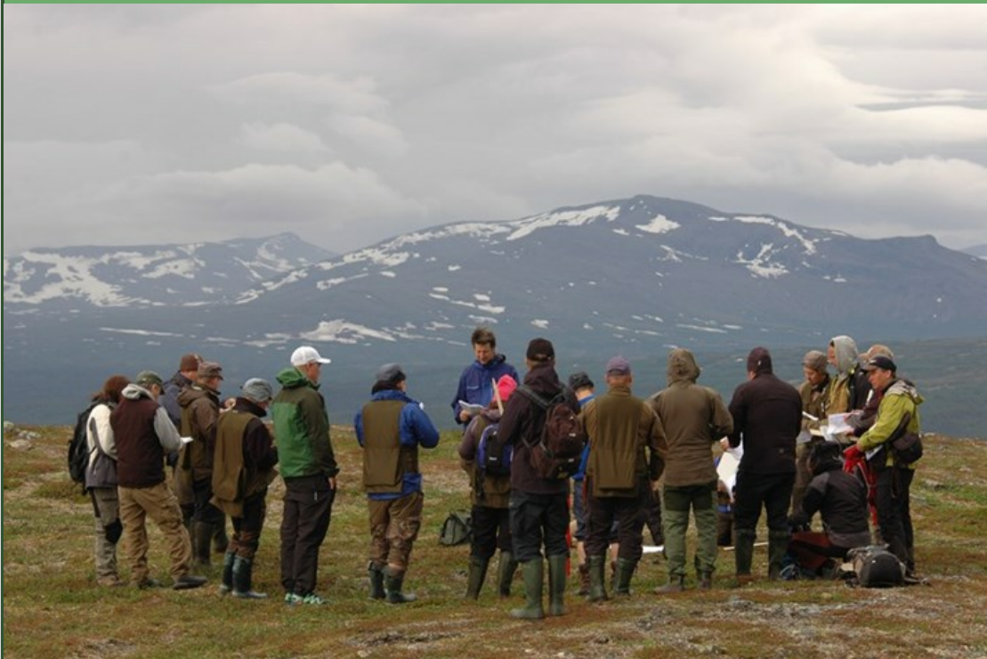
Fältutbildning i Vålådalen. Fältinventering görs i olika typer av landskap och betesmarker.

På detta sätt vill vi informera er som arbetar inom rennäringen om Sametingets arbete med att utveckla en långsiktig och framåtsyftande verksamhet rörande renbruksplaner. Om du inte är intresserad kan du avregistrera dig från kommande nyhetsbrev längst ner i detta utskick. Om du tycker det här är bra information för någon annan som du känner, får du gärna sprida den. Det går också att prenumerera på nyhetsbrevet genom att skicka ett mejl till info@sametinget.se med namn och aktuell e-post.